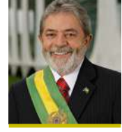
معالي السيد لويس إيناسيو لولا دا سيلفا رئيس البرازيل السابق (ضيف شرف الندوة)