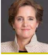
سعادة السيدة أيس أولبرايت الرئيس التنفيذي للشراكة العالمية للتعليم