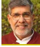
سعادة السيد كلاش ساتارثي حائز على جائزة نوبل للسلام لعام 2014